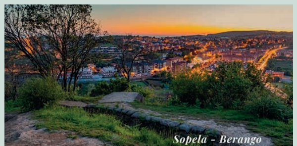
Sopela - Berango

Horretaz gain, apirilaren 9an, goizeko 11etan, "Meteoritoaren aztarna aurkitzen" bisitaldi berri bat egingo da. Ibilbidean zehar Arriatera-Atxabiribil hondartzara zeharkatuko da, Flysch eta bere itsaslabarrak begietsiz, baita dinosuroen desagertzea markatzen duen K/T muga ere. Bisita bietan plazak mugatuak izango dira eta, beraz, ezinbestekoa izango da alde zuzeneko izena ematea turismo@sopela.eus helbide elektronikora idatziz.