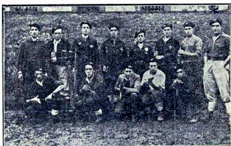
Argueki onetan ikusten diren euzko-motokluak, Sopelara ta Gamnizt'kuak dira. Amatrako zehabakja orri-duten dabe, ta guca ofietara justeko gertuta diragoz.